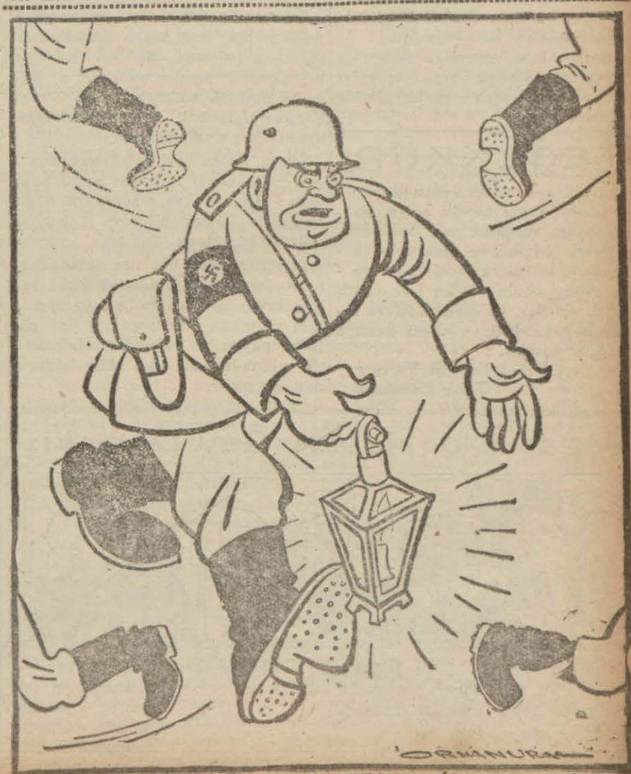
Almanya müttefik arıyor!

Bir gazeteci Ruzveltten, Pe - tain - Hitler görüşmelerini ile alâka - dar olarak Vichy hükümetini hâlâ dost bir devlet gibi telâki edip et - mediğini sormuştur. Ruzvelt bu su - ale evet cevabını vermiştir.