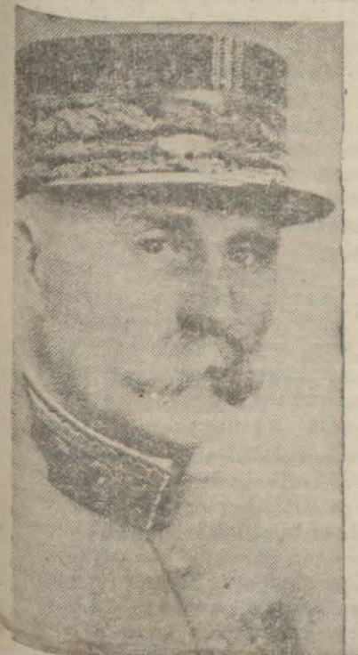
Mareşal Petain (Yazısı 3 üncü sayfada)

Tunusu Fransa ile İtalya, Fası ve İspanya ile Fransa taksim edeceklermiş