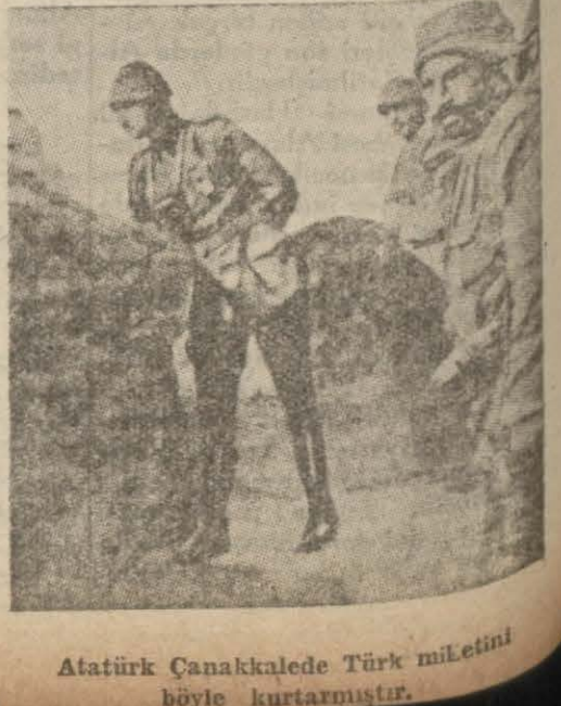
Atatürk Çanakkalede Türk milletini böyle kurtarmıştır.